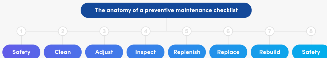
شکل ۲: چک لیست های نگهداری

تا به تکنسین ها کمک کند هر چه سریعتر، به طور موثر و ایمن این خرابی را برطرف کنند. چک لیست های نگهداری اضطراری باید از ساختار وظایف زیر پیروی کنند: